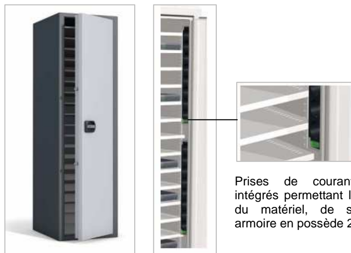
Prises de courants (220V) intégrés permettant la recharge du matériel, de série cette armoire en possède 20.

Parois et porte en acier de 2 mm d'épaisseur. Cette armoire dispose de 20 étagères séparées par 65mm d'espace les unes des autres.