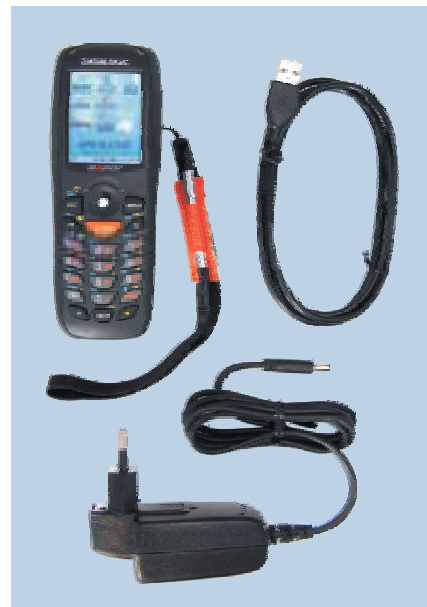
Contenu du package